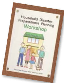
わが家の災害対応ワークブック英語版も販売中です。

地震が少ない国からの渡航者や移住者は、地震を学ぶ機会の少なさから、発災時どうすればよいのかわからないといった不安を抱えています。研修では今まで特に関心が高かった内容、家庭でのリスクの防止・軽減方法、避難手順、家庭での備蓄品など、災害への備えの基本的な内容も盛り込まれています。